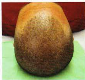
Effet rasé, après le traitement.